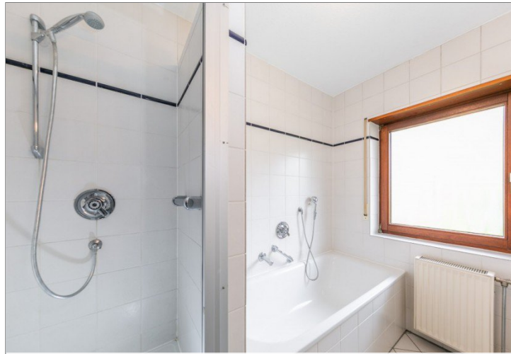
Bad mit Wanne und Dusche