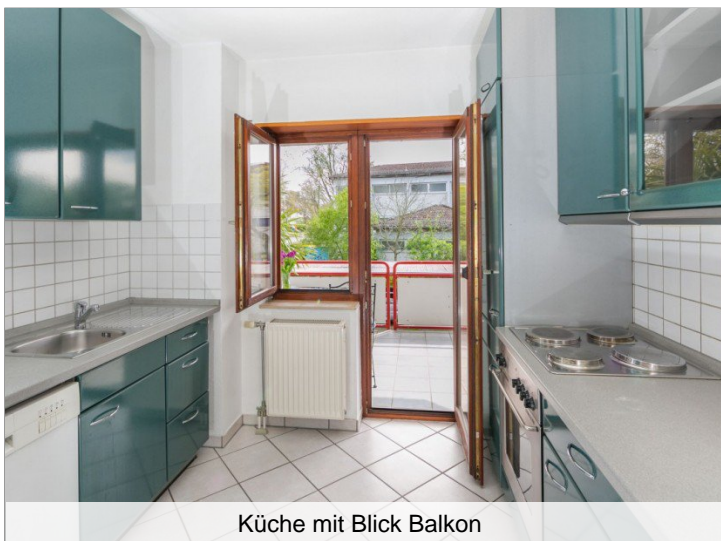
Küche mit Blick Balkon