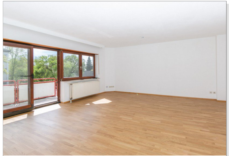
Blick zum Balkon