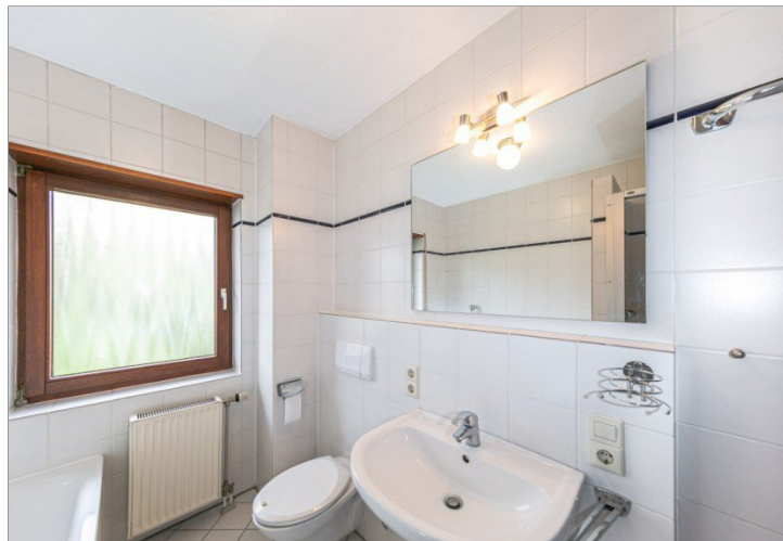
Badezimmer mit Tageslicht