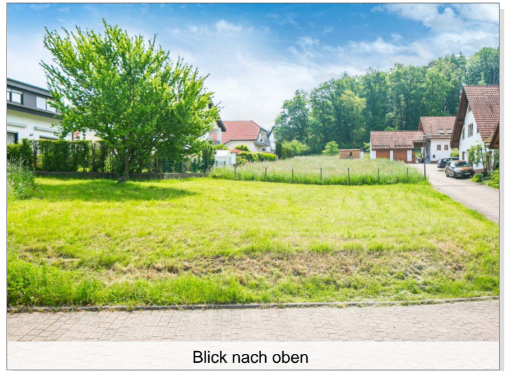
Blick nach oben