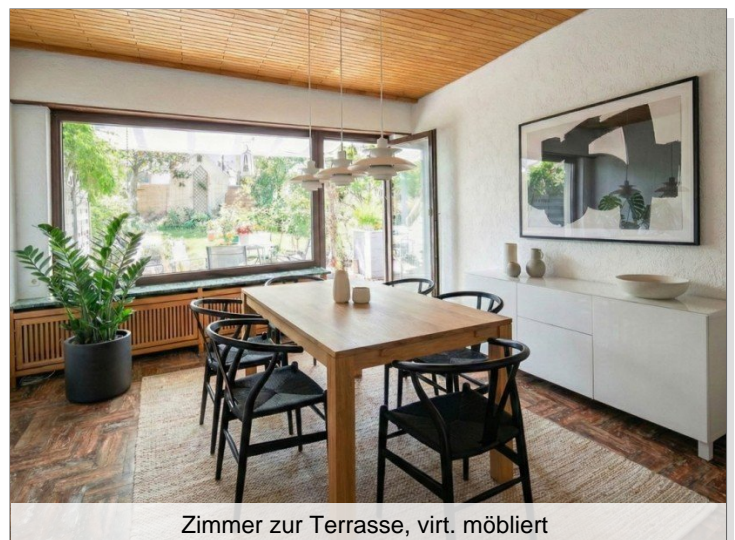
Zimmer zur Terrasse, virt. möbliert