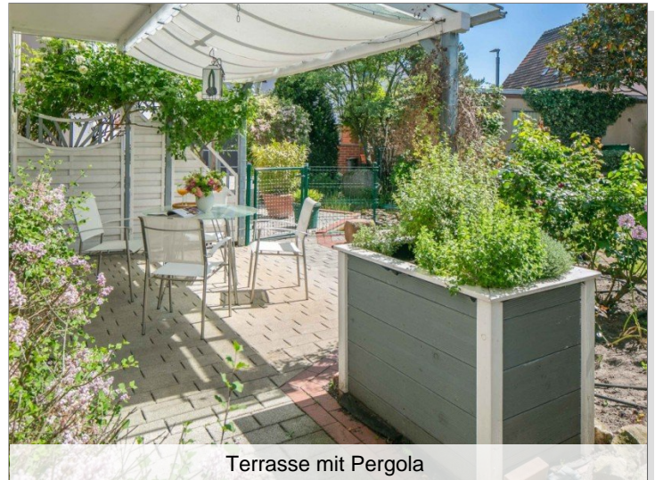
Terrasse mit Pergola