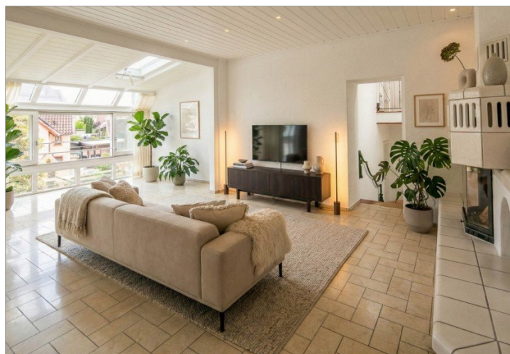
Wohnzimmer 1. OG, virt. möbliert