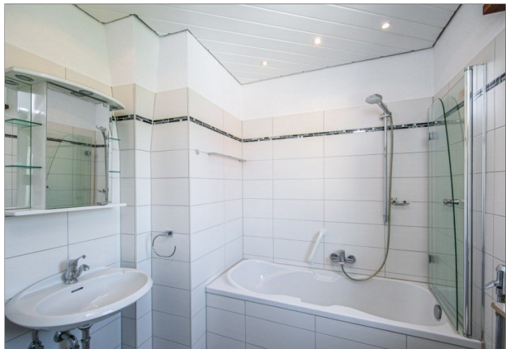
Bad 2. OG