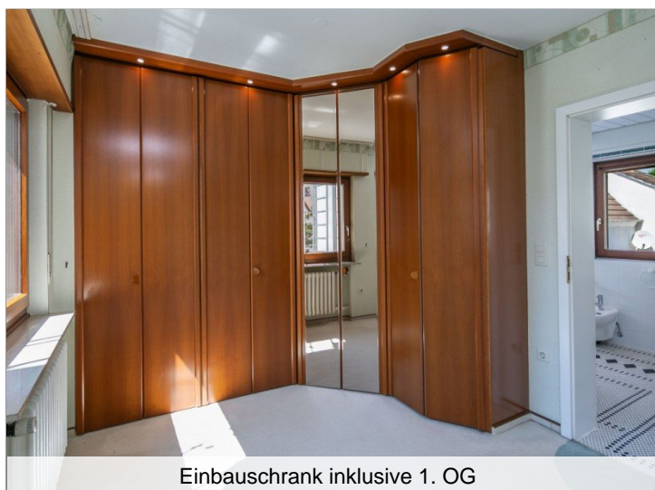
Einbauschränk inklusive 1. OG