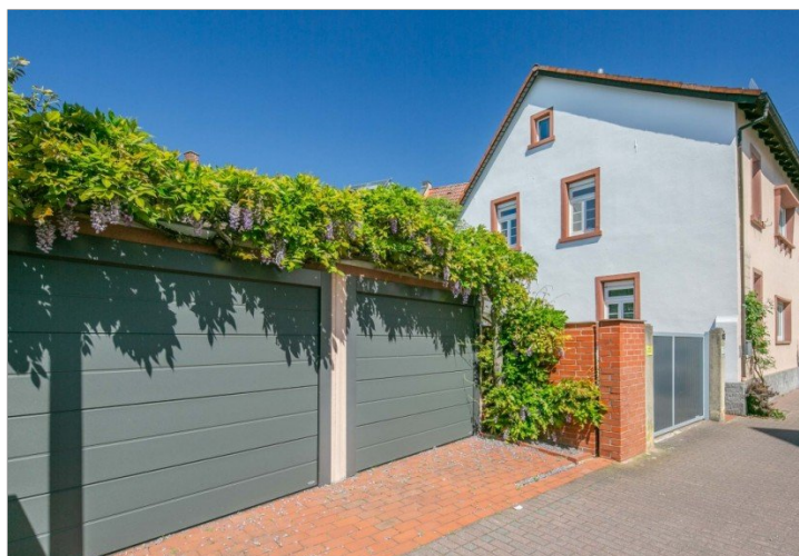
Garage links, el. Tor