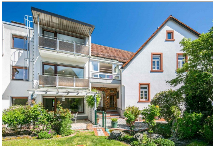
Wohnen in Viernheim