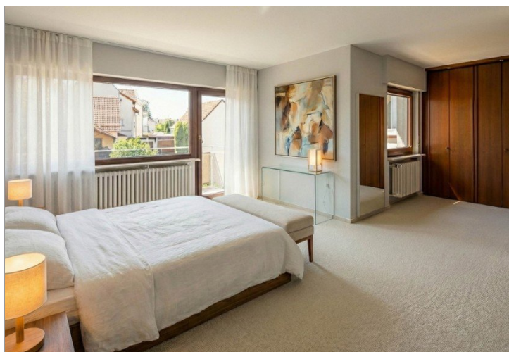
Schlafzimmer 1. OG, virt. möbliert