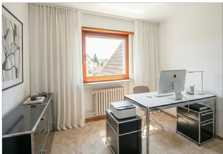
kleines Büro 2. OG, virt. möbliert