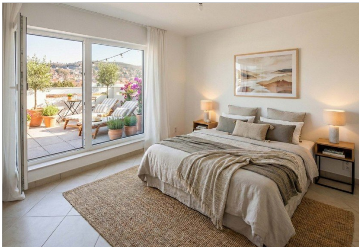
Schlafzimmer 3, virtuell möbliert