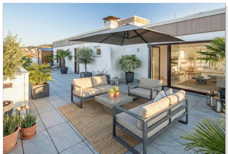
Westterrasse. virtuell möbliert