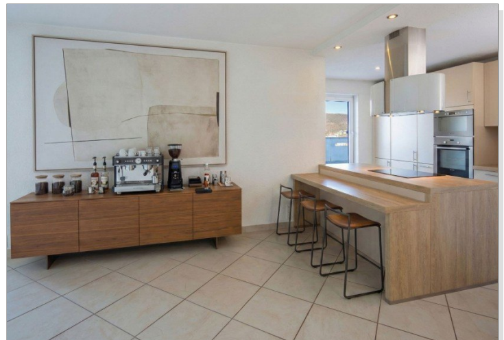
Kochen, Essen, virtuell möbliert