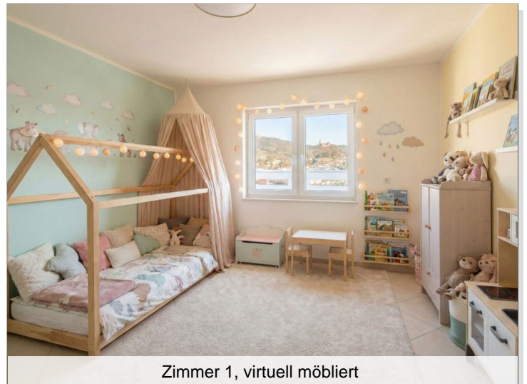
Zimmer 1, virtuell möbliert