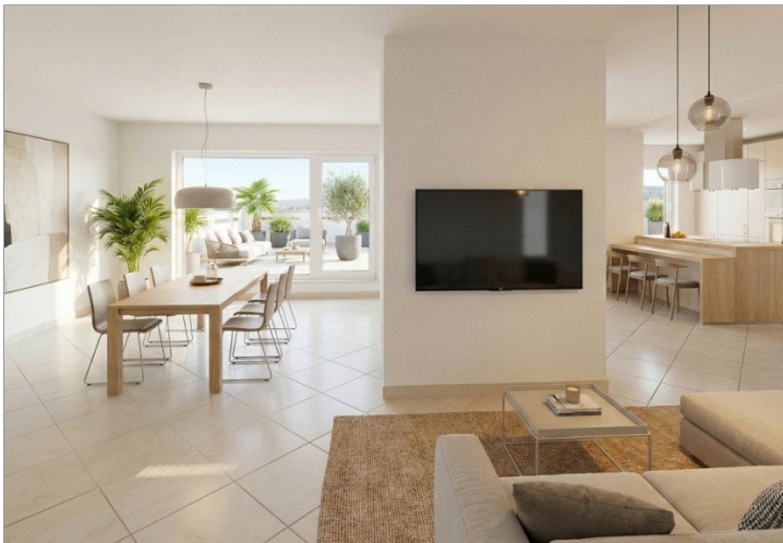
Wohnen-Essen-Küche. virtuell möbliert