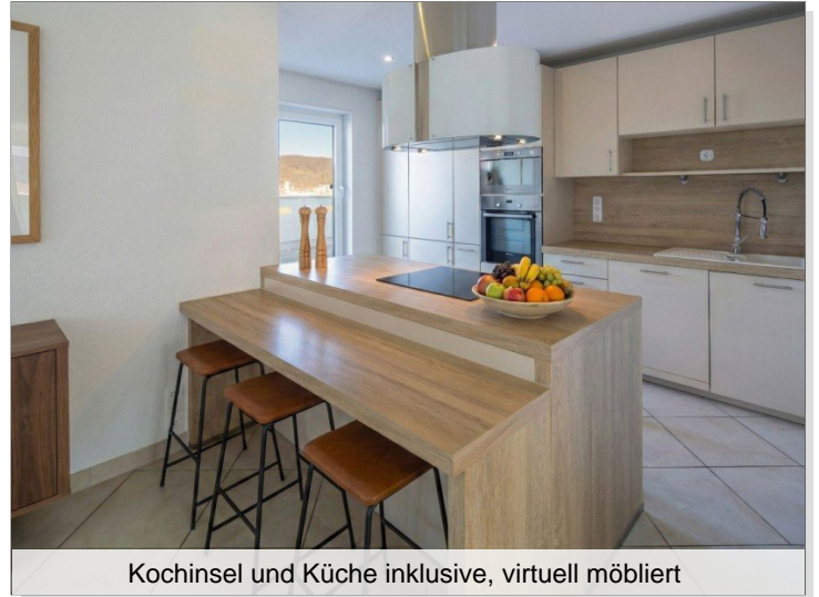
Kochinsel und Küche inklusive, virtuell möbliert