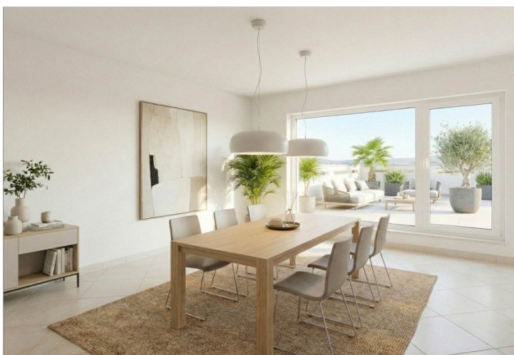
Essbereich, virtuell möbliert