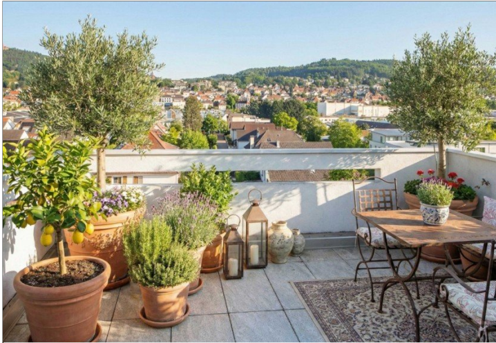
Ostterrasse virtuell möbliert