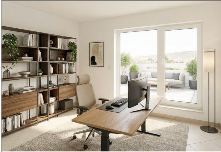
Zimmer 2, virtuell möbliert