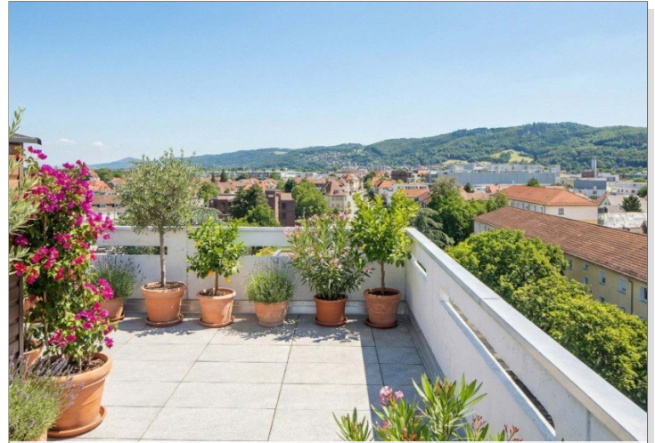
Terrasse mt Blick Bergstraße, virtuell möbliert