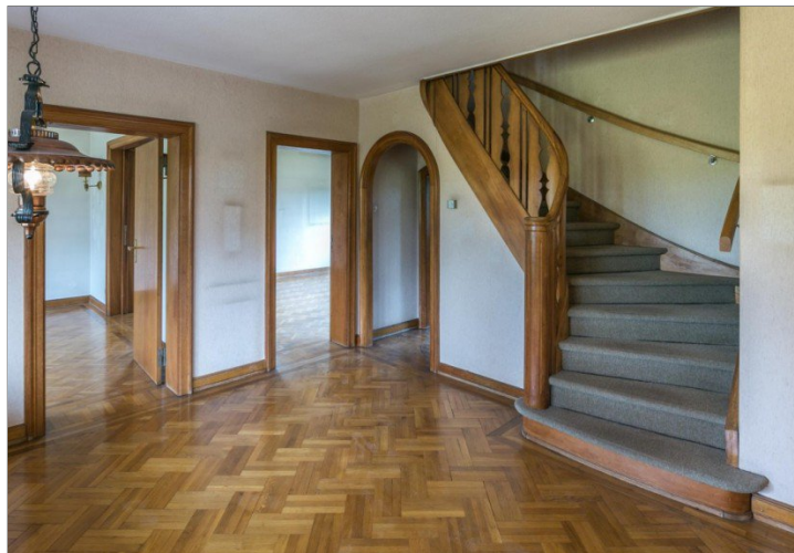
Diele und Treppe