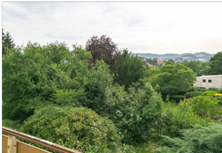
Ausblick zum Nachbarn