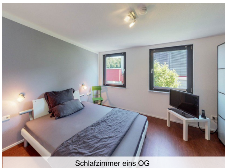
Schlafzimmer eins OG