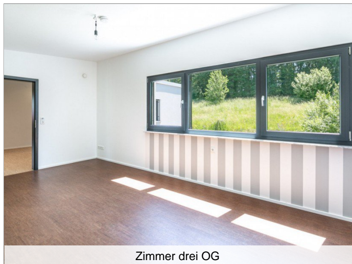
Zimmer drei OG