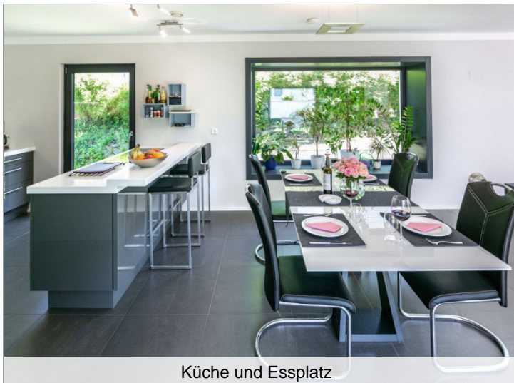
Küche und Essplatz