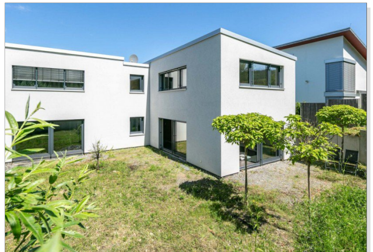
Ein Haus für die Familie