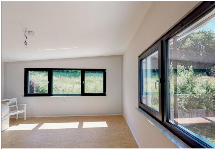
Zimmer zwei OG