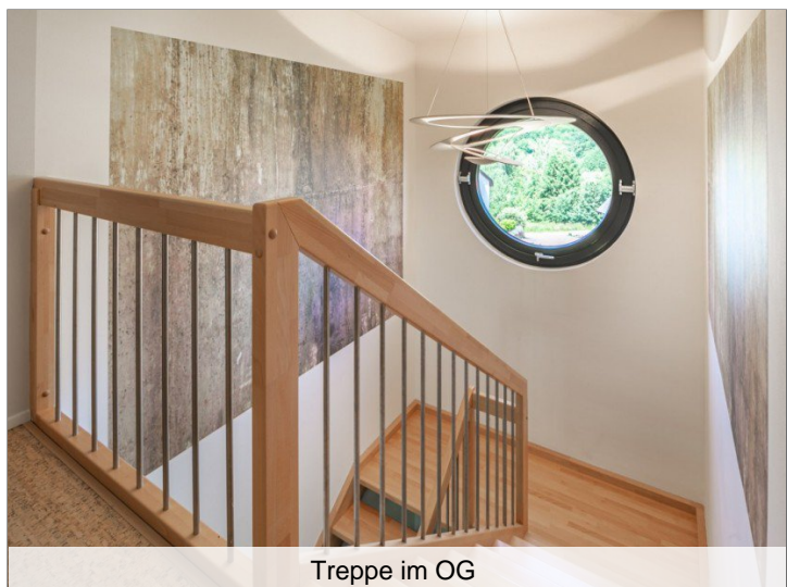
Treppe im OG