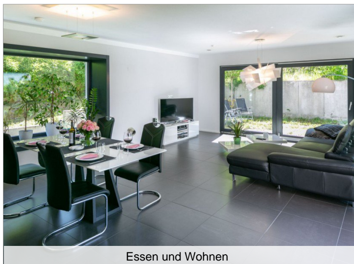
Essen und Wohnen