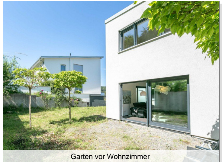
Garten vor Wohnzimmer