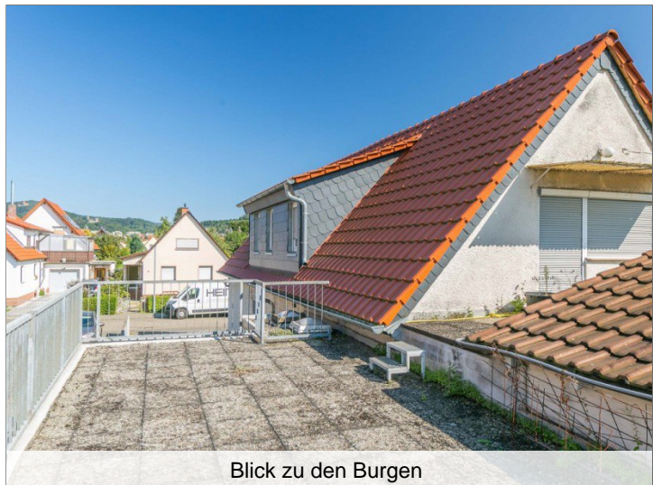
Blick zu den Burgen