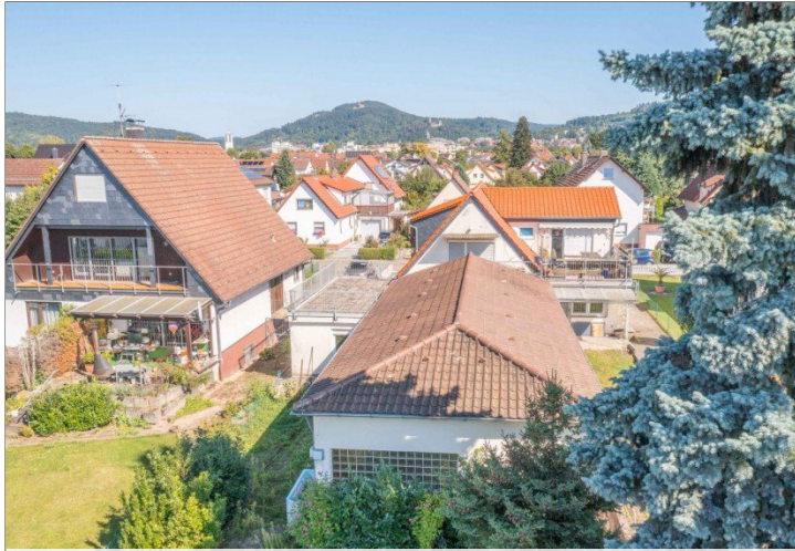
Blick nach Norden