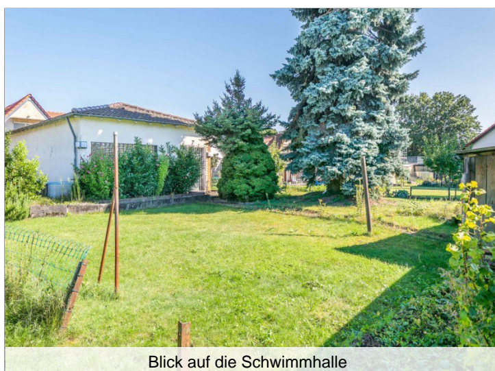
Blick auf die Schwimmhalle