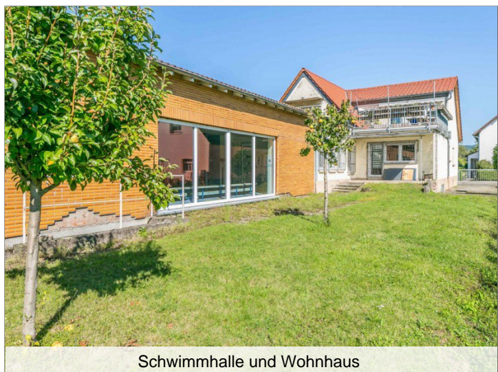
Schwimmhalle und Wohnhaus