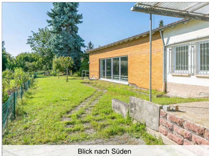
Blick nach Süden