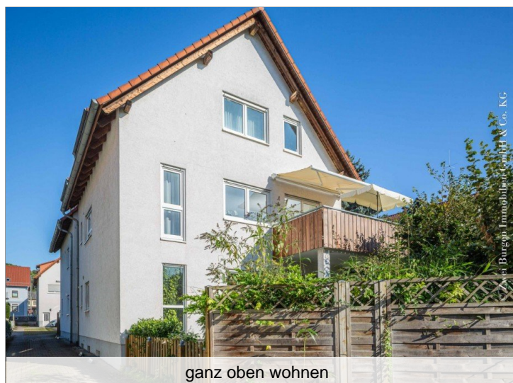
ganz oben wohnen