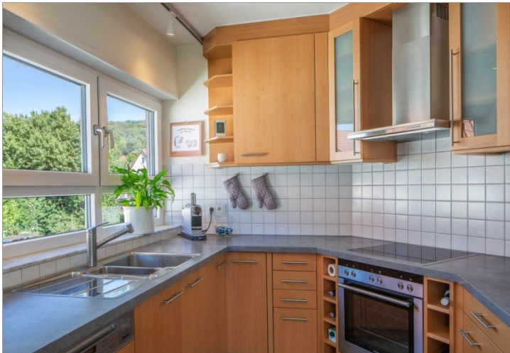
Küche mit Blick ins Grüne