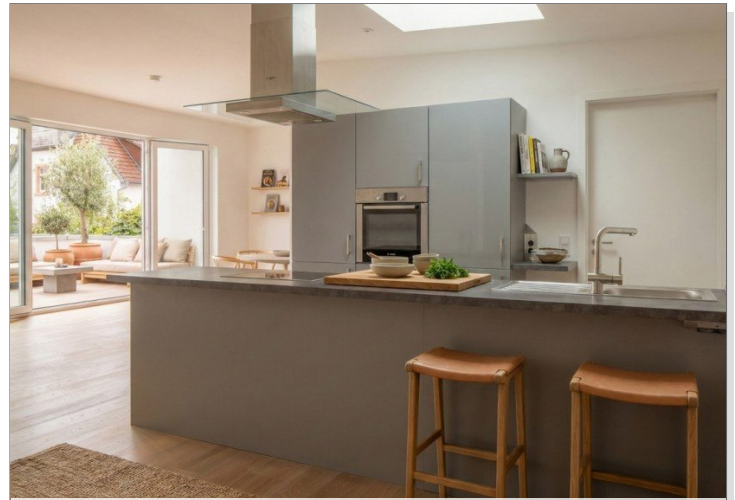
Einbauküche inklusive, virt. mobliert