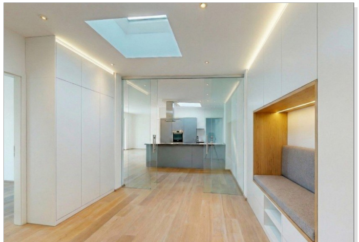
Möblierungsvorschlag mit Glaswand