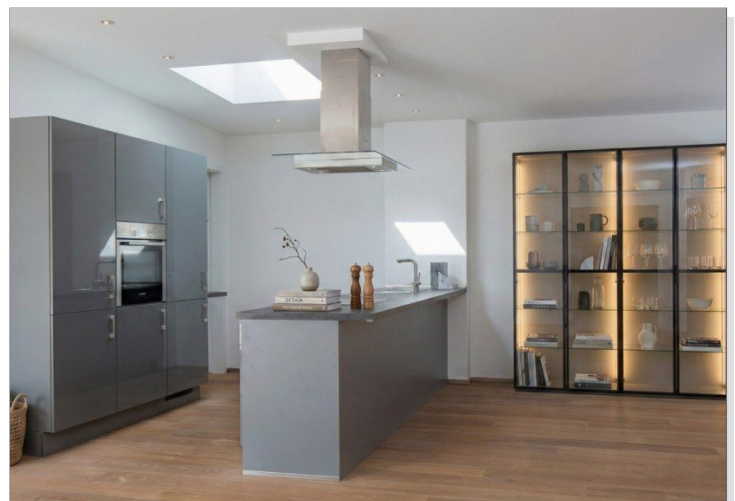
offene Küche inklusive