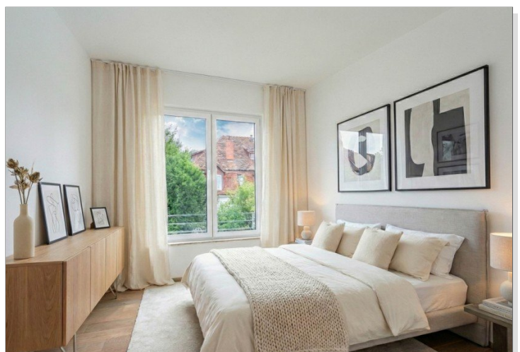
zweites Schlafzimmer, virt. mobliert