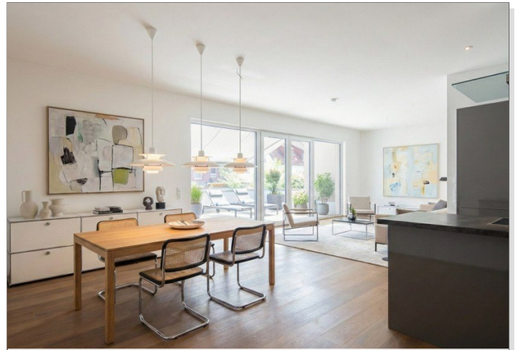
loftartig, virt. mobliert