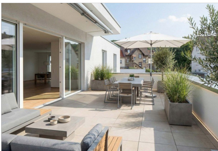
ruhige, Wohnlage, virt. mobliert