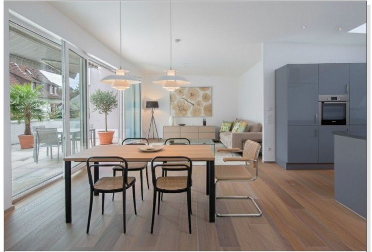
Wohn- und Essbereich, virt. mobliert