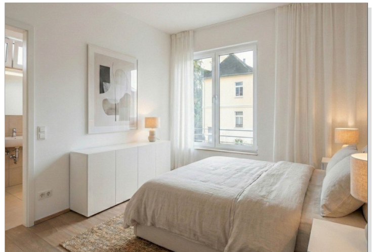
Schlafzimmer + Bad ensuite, virt. mobliert