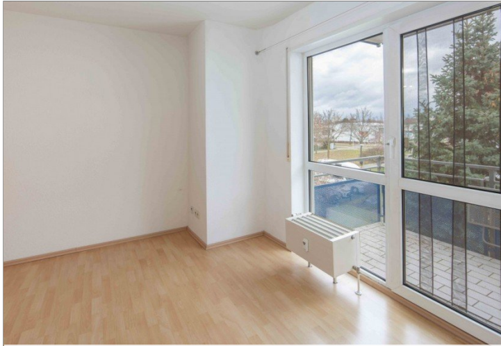
Blick zum Balkon