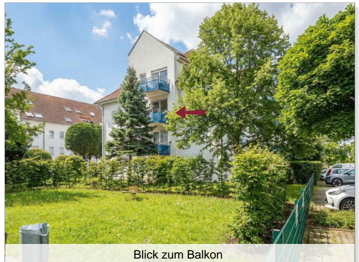
Blick zum Balkon