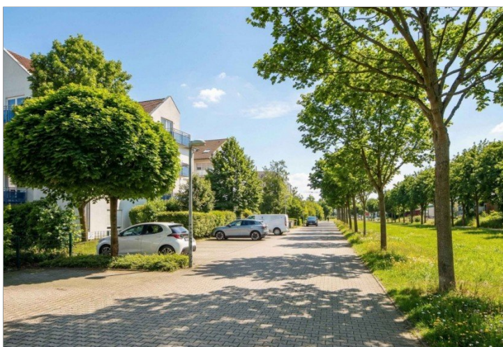
freie grüne Umgebung