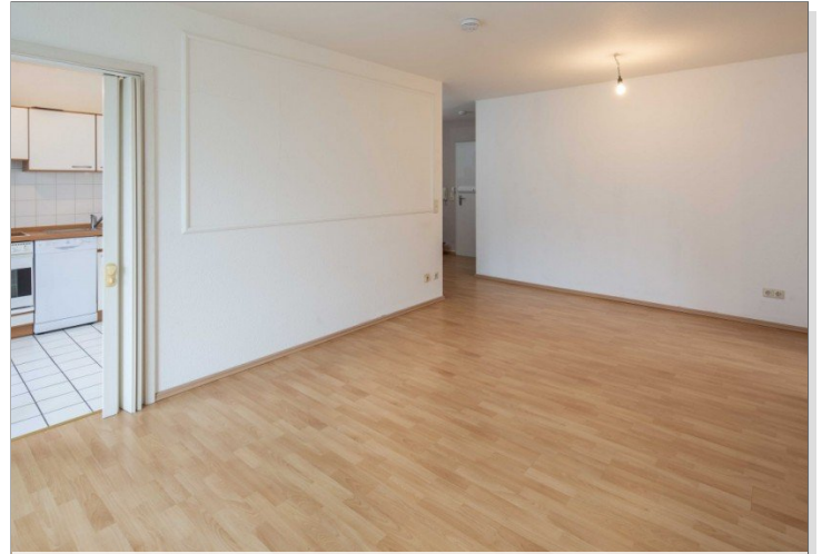
Blick zur Küche