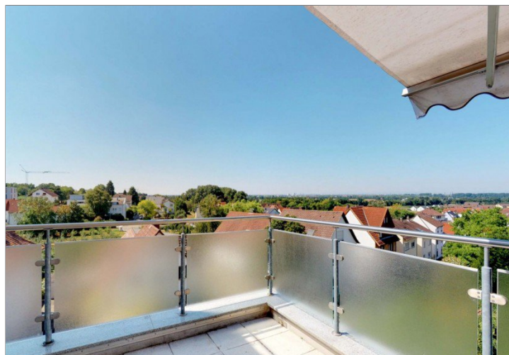
Ausblick bis in die Rheinebene