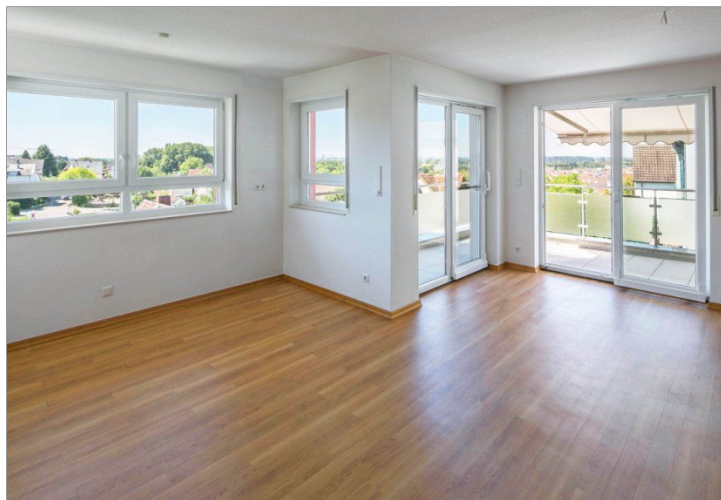
hell und freundlich