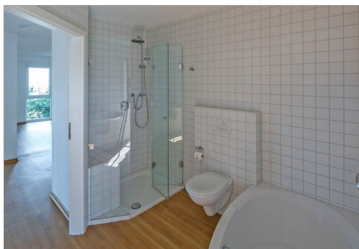
Eckwanne und Dusche