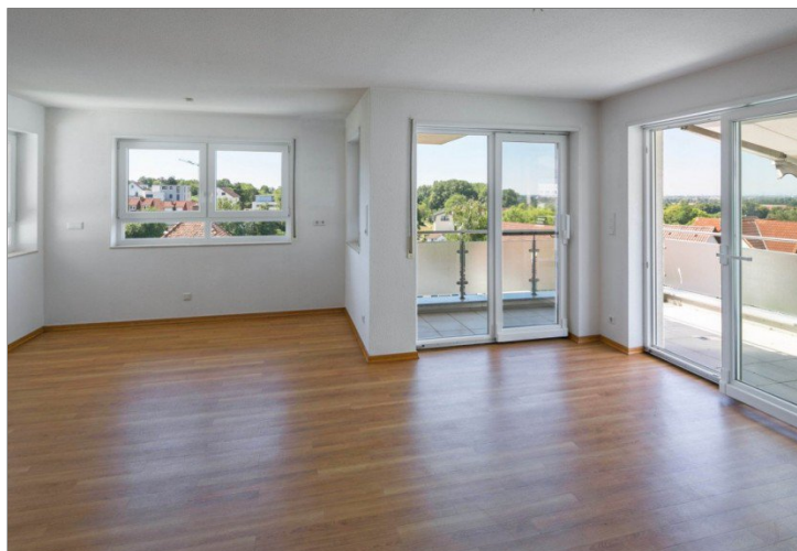
Wohnbereich mit Ausblick