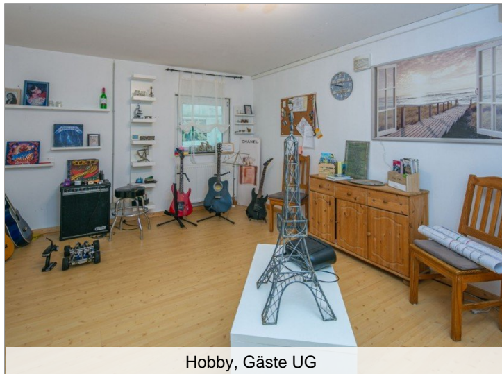
Hobby, Gäste UG