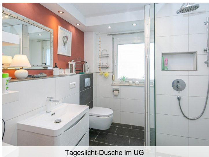
Tageslicht-Dusche im UG