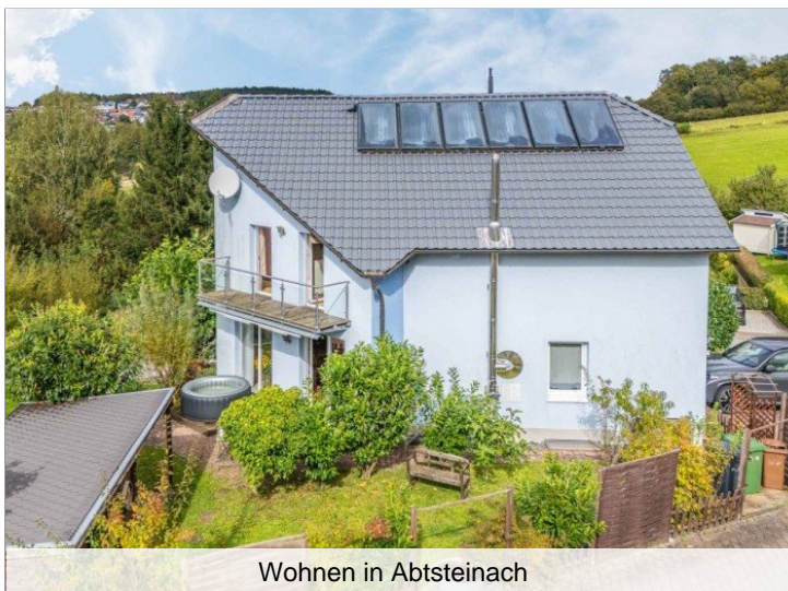
Wohnen in Abtsteinach