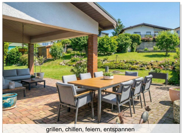
grillen, chillen, feiern, entspannen