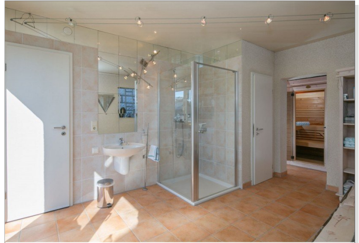
Duschbad + Sauna