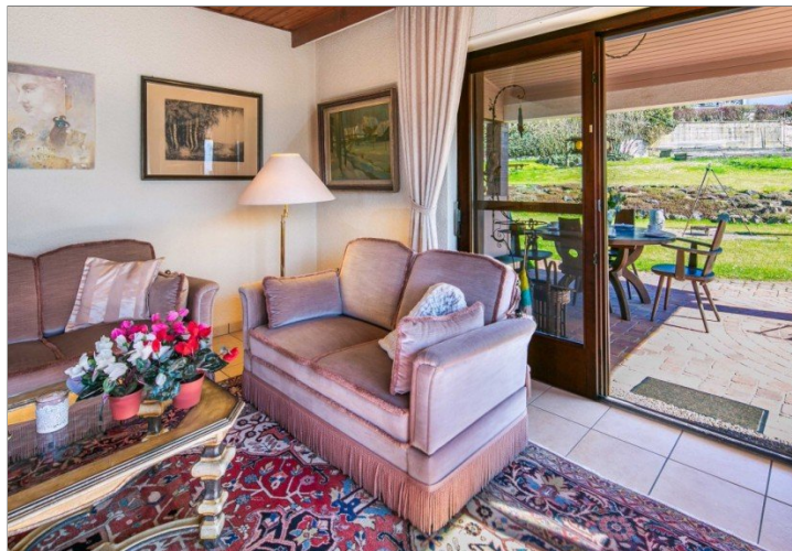
Blick zur Garten-Terrasse