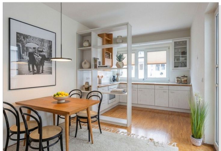
Blick zum Wohnzimmer