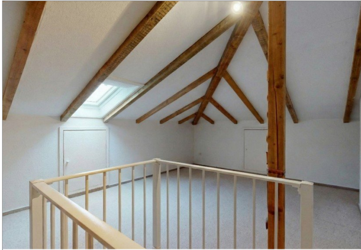
Spitzboden beheizt + Fenster