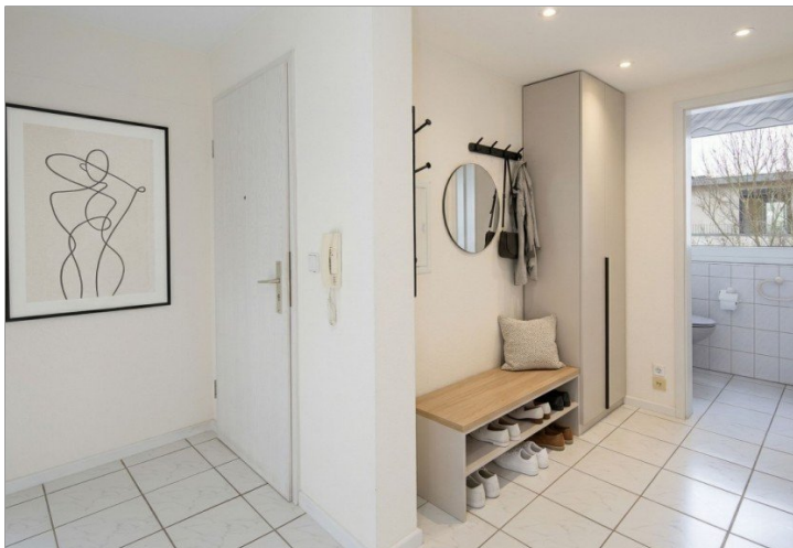
helles Gestaltungsbeispiel Eingangsfur + Gäste-WC