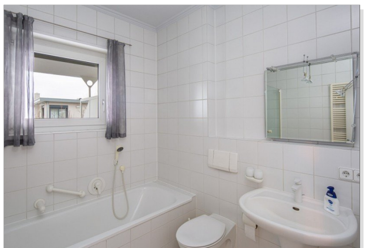
Tageslichtbad mit Dusche