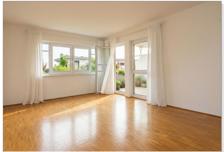
Wohnbereich mit Westloggia